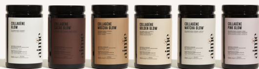
GAMME COLLAGÈNE (COLLAGÈNE GLOW, CACAO, MOCCHA, GOLDEN, MATCHA, PINK) à partir de 59€