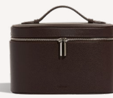
LE VANITY 59€